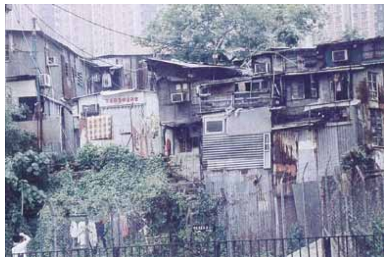
● 下元嶺的寮屋區，約1985年。