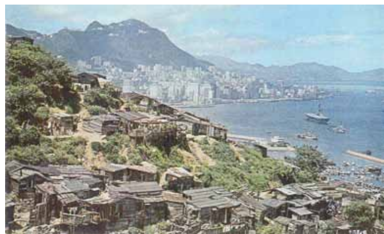
● 北角半山寶馬山的寮屋區，約1967年。

深水埗的石峽尾區，曾數次發生大火，最嚴重的一次是發生於1953年12月25日聖誕夜，災場包括上、中、下白田村，石峽尾村以及上、下窩仔村，災民近六萬。因石峽尾大火，令致政府積極實行徙置計劃，興建稱為徙置大廈的平民屋宇，以安置災民。