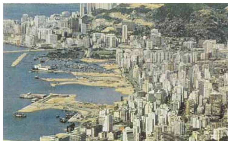
● 約1964年的灣仔及天后區，右上方可見大坑及天后區一帶的寮屋區。

香港最早的寮或木屋區，是位於城隍街與士丹頓街之間。1883年此區的寮屋連同城隍廟，同被拆遷以建皇仁書院，所在現為PMQ。