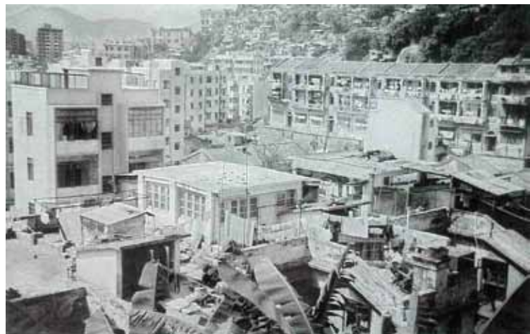
● 約1960年的大坑區，可見背後的山邊木屋。