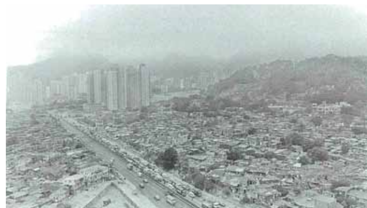
● 鑽石山、大磡村及元嶺一帶的寮屋區，約1985年。