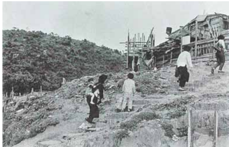
● 北角半山的寮屋區，1958年。所在即將闢建雲景道。