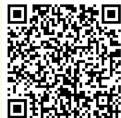
• 可用手機鏡頭掃描以上二維碼瀏覽平台。

「G5G 照顧者好幫搜」是一個網上護老資訊互動平台，網站G5gcarer.com 有全港安老資源地圖，搜羅18區的安老服務；也有針對護老題目的討論區，讓照顧者互相交流及支持；還有聊天機器人(Chatbot)協助解決照顧疑難，照顧者可以透過WhatsApp(電話號碼：6311 6366)與聊天機器人對話，快捷尋找最適切安老方案。