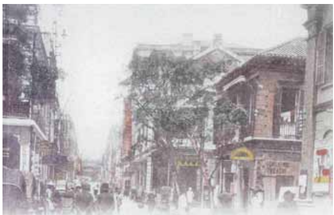
● 約1918年皇后大道中，右方是與戲院里交界的香港影畫戲院。