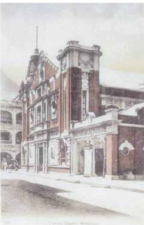
● 砵典乍街的域多利戲院，約1918年。