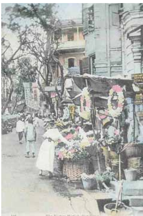
● 由皇后大道中上望雲咸街，約1918年。樹旁的矮金字屋是比照戲院。亦可見其布招廣告。