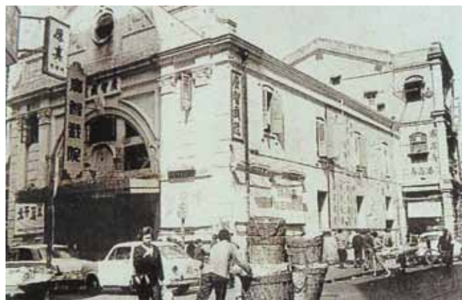
● 油麻地甘肅街的廣智戲院，約1955年。右方是廟街。