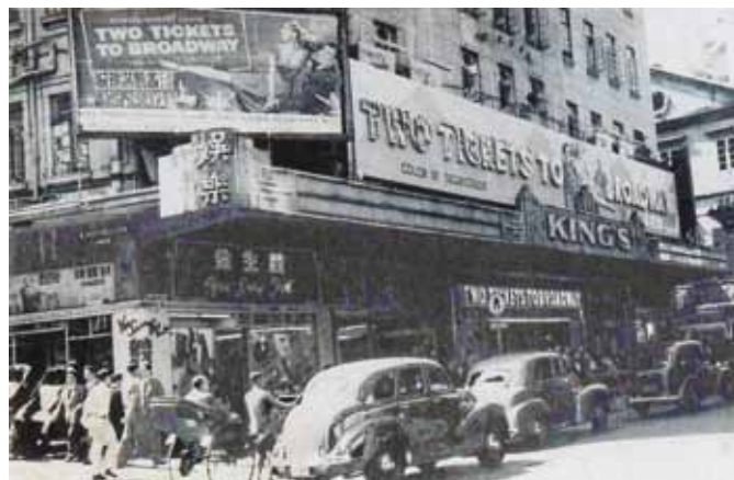
● 由比照戲院及舊香港會所改建的娛樂戲院，約1953年。