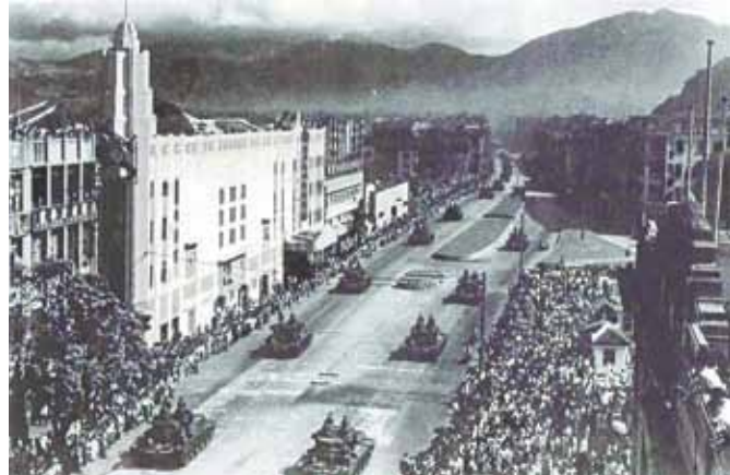
● 彌敦道與甘肅街交界的平安戲院，攝於1950年代初英皇壽辰軍演期間。