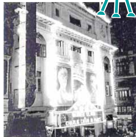
● 第一代皇后戲院，1935年慶祝英皇喬治五世登位銀禧期間。

1930年，新比照戲院拆卸，連同比鄰的舊香港會所，改建成有「冷氣開放」的娛樂戲院（現娛樂行所在），於1931年落成。