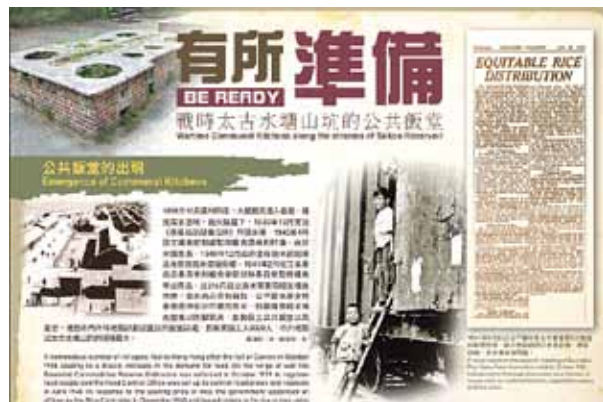
●古物古蹟辦事處的線上展覽，介紹戰時太古水塘山坑的公共飯堂。

九文化區 M+ 博物館早前的霓虹燈互動展覽，有短片介紹霓虹燈的製作、著名藝術家訪問，還有由公眾提交的霓虹招牌照片勾劃出來的香港霓虹地圖，紀錄着仍存在和已消失的霓虹燈。