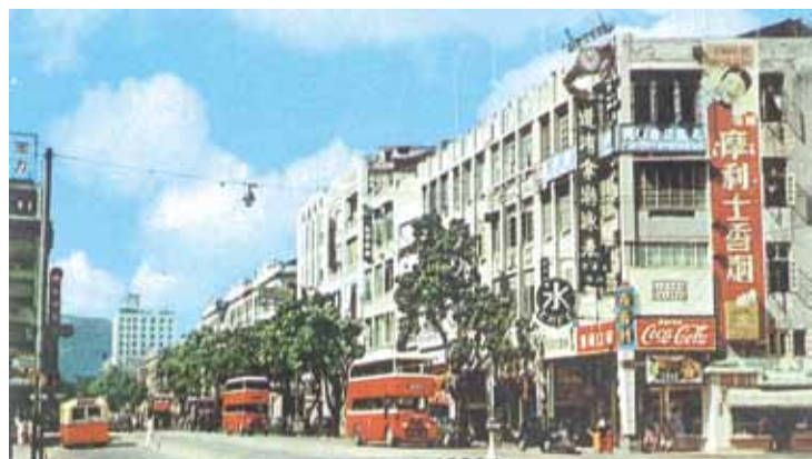
● 油麻地彌敦道與甘肅街交界，一列無水廁設備的樓宇。