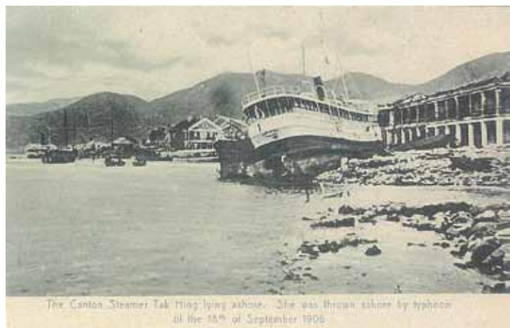
● 1906年9月18日，被颶風吹致擱淺於油麻地海邊之省港汽船「德興」號。

1990年代中，避風塘被填平，以闢「西九」地段，在上面興建往機場的「三號幹綫」、「西隧」的出入口及機鐵站等，多座住宅屋苑亦在此落成。