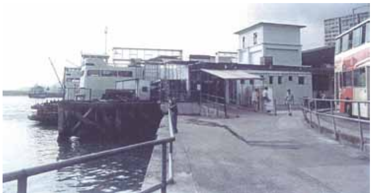
● 1992年的佐敦道碼頭。左中部可見避風塘的堤壩，巴士後為「八文大廈」。