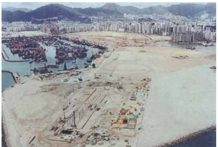
● 正在填海的「西九」地段，約1993年。右中部「八文大廈」的左邊，原為舊避風塘。左中部可見當年闢成的新避風塘。