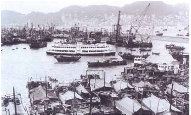
● 油麻地避風塘，約1970年。可見一由山東街旺角碼頭開出，往中環的渡海小輪。