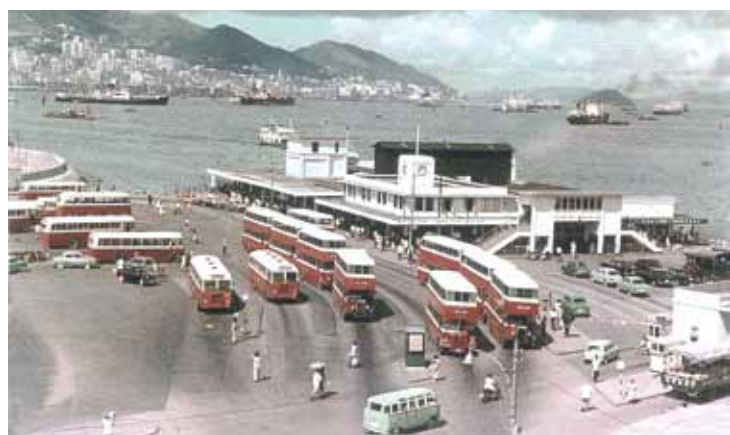
● 約1960年佐敦道碼頭和巴士總站。其右方為避風塘的起點。