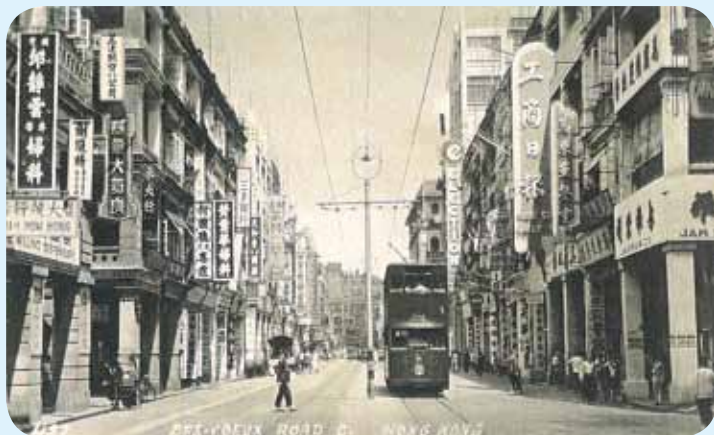
● 約 1953 年的德輔道中。

電車背後的爹核行 DAVID HOUSE，樓下有一惠康辦館（超級市場），爹核行於1966年改建為聯邦（現永安集團）大廈，惠康則遷往戲院里的畢打街地下。