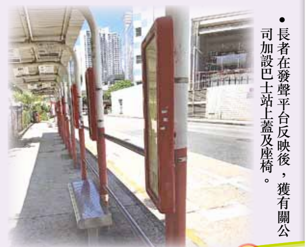
長者在發聲平台反映後，獲有關公司加設巴士站上蓋及座椅。

當大家充分使用這個長者友善社區的平台發聲時，社區自然可以「齡活」起來，也讓各個社區作好準備，早日回應城市人口老化所面對困難。