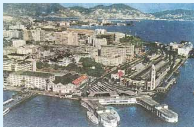
● 尖沙咀區約攝於 1960 年。

水警總部。彌敦道中可見剛落成的美麗都及文遜大廈、火車站與梳士巴利道間，有粉紅色金字屋頂的是九龍郵政局。