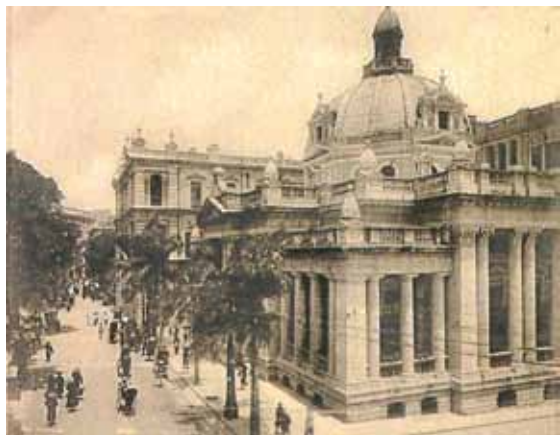
●皇后大道中，大會堂西鄰的匯豐及渣打銀行，約1905年。