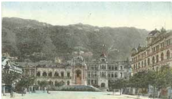
●皇后像廣場，約1912年。銅像左端是大會堂，右端是匯豐和太子行。