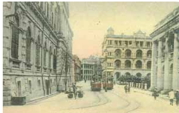
●由木球會（遮打花園）西望德輔道中，約1915年。左方為第一代大會堂，右方為高等法院及太子行。

位於皇后大道中7號，迄至1974年，亦為香港的發鈔銀行，是匯豐的附屬機構，於1980年代結業。有利的隔鄰有荷蘭銀行（大樓）、球義大廈，以及背後位於德輔道中的廣東銀行。這一組大廈於1990年代初，改建成皇后大道中9號的嘉軒廣場。