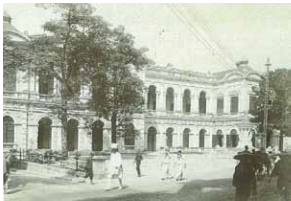
●皇后大道中，第一代大會堂與噴水池，約1875年。