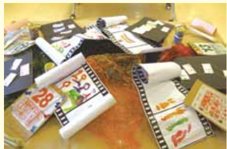
●透過藝術讓長者回味人生，與家人分享晚晴心願。

心事，倒不如好好暢快談一場。與其忌諱不談，埋藏很多心願，期望身後事能一切從簡。小組打破家人一直的禁忌，一家人分享道出從前不會如此傾談，小組卻為他們提供了很好的平台，能寬容談論生死。