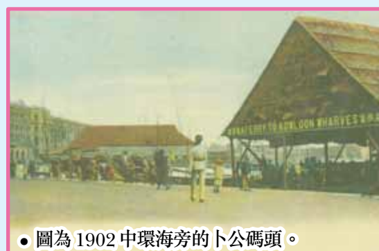
● 圖為1902中環海旁的卜公碼頭。

各位可曾在此天星碼頭登船過海，以及在卜公碼頭乘涼、垂釣及乘搭「嘩啦嘩啦」（電船仔）嗎？