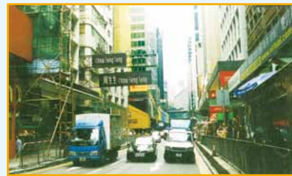
• 現皇后大道中近興瑋大廈一帶。

由利源東街向東望。中部可見位於畢打街，落成於 1862 年的鐘塔，因阻交通於 1913 年被拆卸。其旁的高等法院及郵政總局建築於 1924 年改建為華人行及畢打行。