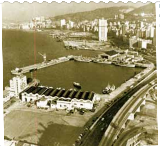
● 圖中停泊戰艦的添馬艦基地，已是政府總部的所在。