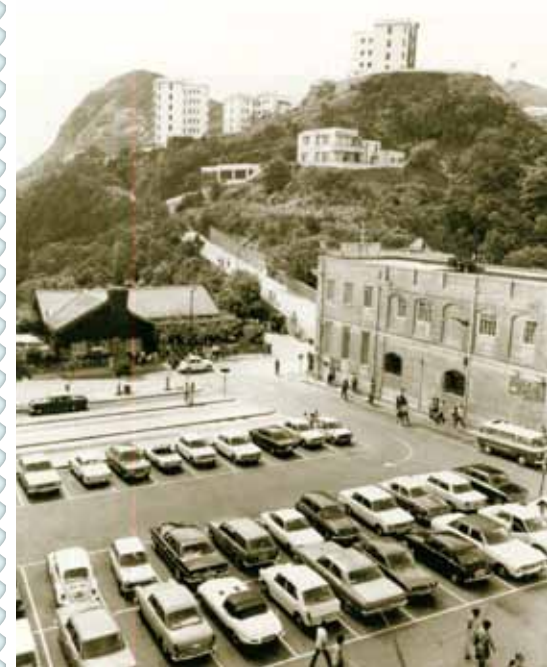
● 你知道圖中的停車場，是現在的甚麼地方？