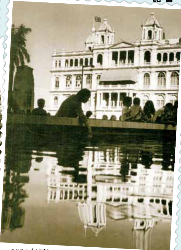
● 1981 年拆卸的香港會所。