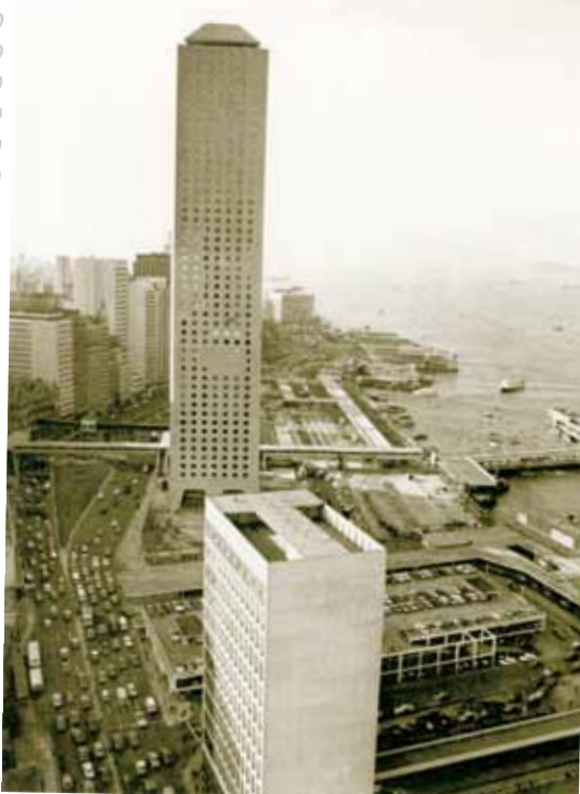
● 1970 年的康樂大廈 (現改名為怡和大廈) 周遭是低層建築物。