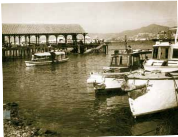
● 你還記起當年卜公碼頭的所在？

共同推進香港的繁榮發展。大家不妨用以下舊照與「老」朋友相聚時，回憶你當年曾踏足的故地情景，或與年青人大談當年至今的發展；這不失為一種生活情趣，在無數古舊的建築或古迹相繼消失中，此些舊照正好助你尋蹤，同時也可建立你對箇中事與物認識的權威，當然也可以展示你對當中發展的付出。