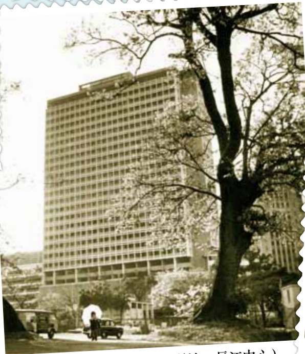
● 1964 年的希爾頓酒店。(現址：長江中心)