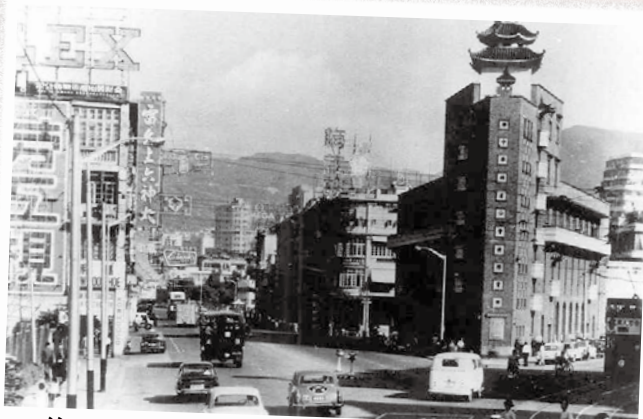
● 約 1960 年的軒尼詩道，左方可見雷允上六神丸的廣告牌。