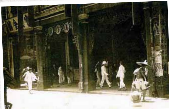
● 皇后大道中的馬百良藥廠，約 1925 年。