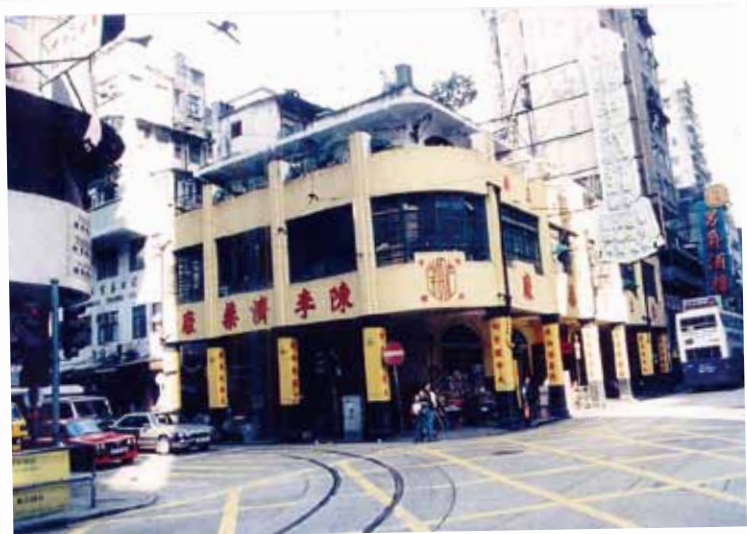
● 西環陳李濟藥廠 1992 年。

1900 年代初，有不少內地港開設的藥店，包括皇后大道中的馬百良和同仁堂，英商的屈臣氏藥房亦出售多種的膏丹丸散中藥和藥油。