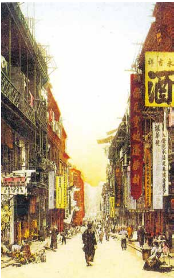
● 威靈頓街的衛元堂，1915 年。