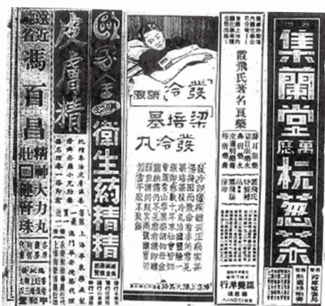
● 1940 年中藥的廣告。