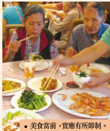
● 美食當前，實應有所節制。

也無法過濾，微粒可直接進入肺底部，損害人體，慢阻肺病及慢性心臟病患者要特別注意。