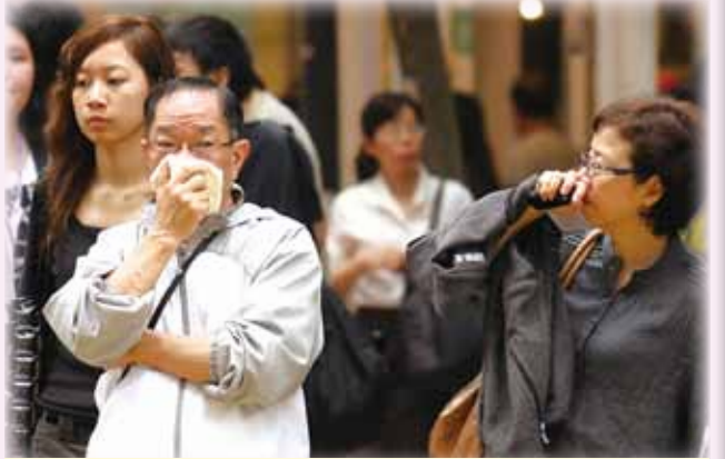
● 防病亦要防沙塵暴。

中醫師公會會長關之義呼籲，市民最重要是避免前往嚴重污染的地區，減少戶外活動，盡量「避其毒氣」，以免肺部變成「吸塵機」。他建議，飲用豬肺、豬脷肉加入百合、淮山、南北杏、陳皮、五爪龍等材料煲成