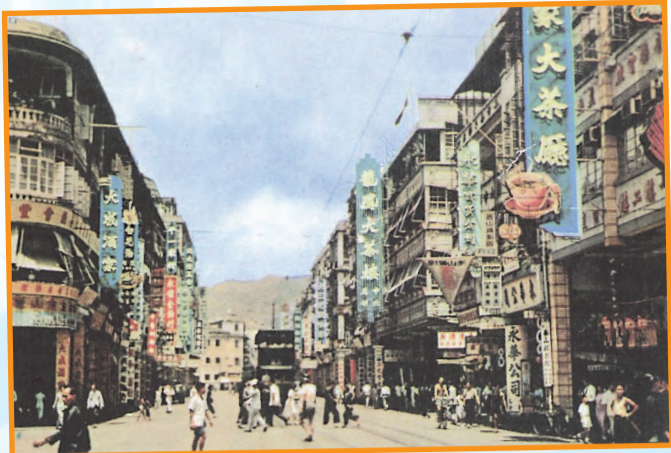
• 約1955年的龍鳳茶樓和大成酒家。