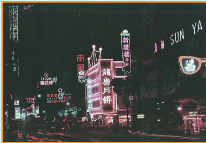
• 彌敦道與山東街的龍鳳茶樓約1964年。