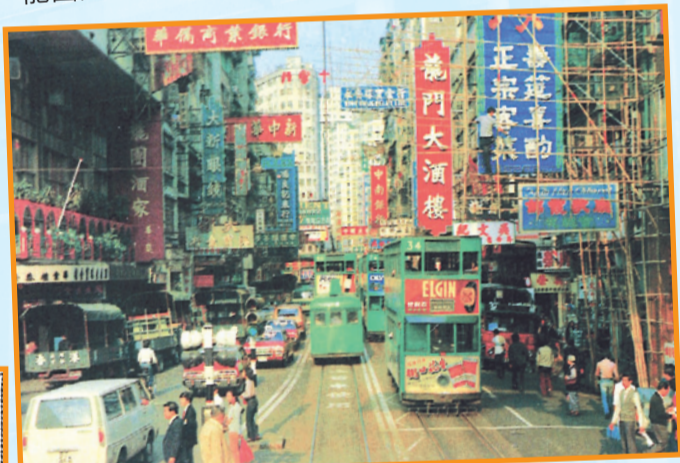
• 龍門酒樓和大成酒家改建的龍團酒家(左)，約1965年。