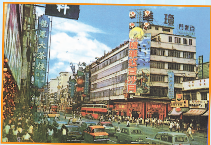
• 龍鳳茶樓與瓊華酒家，約1965年。