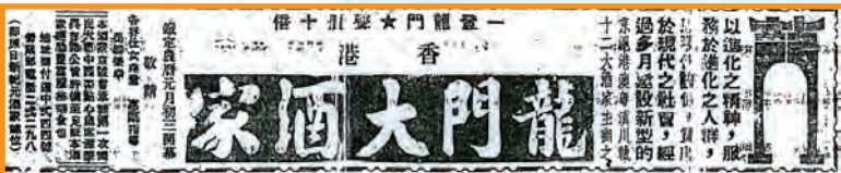
• 1947年1月21日龍門的開業廣告。