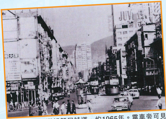
• 由杜老誌道望軒尼詩道，約1965年。電車旁可見龍圖大酒樓。