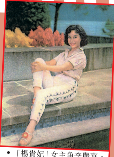
• 「楊貴妃」女主角李麗華。