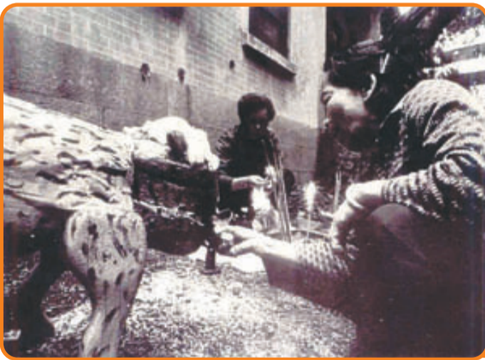
• 在太平山街一帶祭白虎及「打小人」的婦人，約1965年。