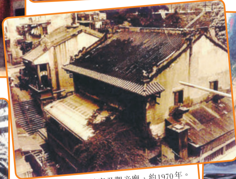
• 太平山街的百姓廟及觀音廟，約1970年。