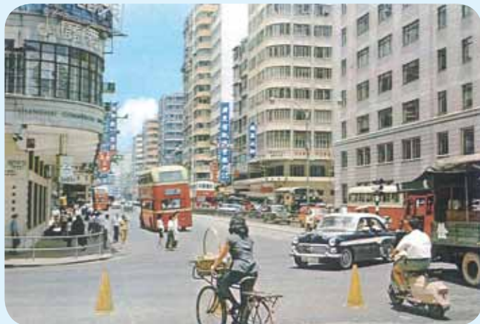
● 由彌敦道向東望，約1965年。