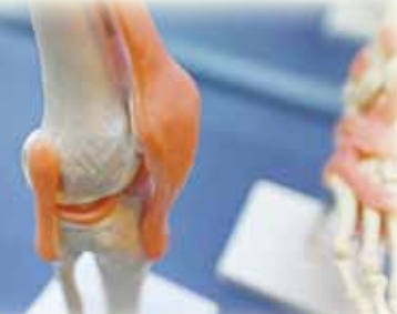
●最近有研究指出，強化臀部及膝部肌肉能更有效減低膝痛。

物理治療傳統的治療方針集中在強化四頭肌及大腿後肌（膕繩肌）的伸展，再配合電療熱敷等止痛。歐陽健指出：「但最近研究指出，比起只強化膝部肌肉，強化臀部及膝部肌肉能更有效減低膝痛及提高膝關節的功能。」紐西蘭和澳洲亦廣泛使用神經肌肉訓練，治療患有嚴重退化性膝關節炎的病人，效果顯著。在生活上，可注意以下小貼士： 一、避免不正確的姿勢和活動。長期蹲下和坐矮椅子都會加劇膝關節的退化；同時要避免長期攜帶及搬運重物，若無可避免，可用拐杖以及手推車。 二、適度活動有助減輕痛楚，越避免活動，關節只會越緊、越痛。散步、水中運動以及健身單車，都是不錯的選擇。 三、當遇上膝痛急性發作，出現