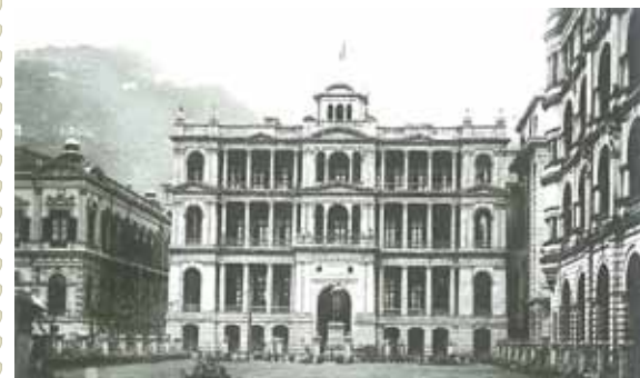
● 滙豐銀行和其前方的是昆臣銅像及廣場，約1925年。右方為太子行。