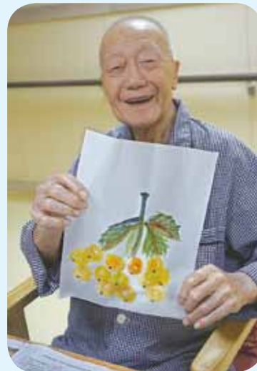
● 藝術活動能令長者笑逐顏開。

活動從去年7月開始至今，已有14間院舍、4間長者日間護理中心及5間長者社區照顧服務券單位的長者受惠，開辦超過100個小組，受惠人次達5000。活動初期，參加者大多表示「我做唔到」，但活動過後，參加者拿着他們的製成品，嘴角上揚，笑容滿載，樂在藝術當中。藝術確實是治療心靈的法術。如有興趣了解，歡迎致電3565 4703與陳姑娘聯絡。