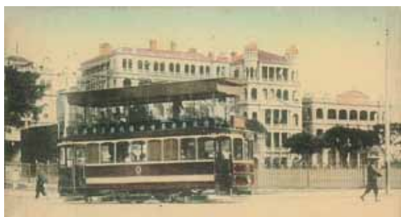
● 約1915年，由木球會（現遮打花園）望遮打道。由右起為太古洋行及東方行（現友邦中心所在）電車背後為馬會大樓。