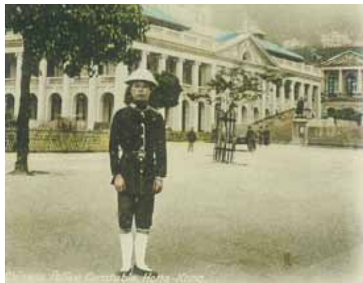
● 遮打道上的警察，約1915年。