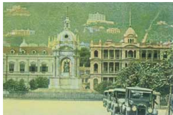
● 遮打道上的皇后像，約1915年。左方為第一代大會堂，右方為第二代滙豐銀行。