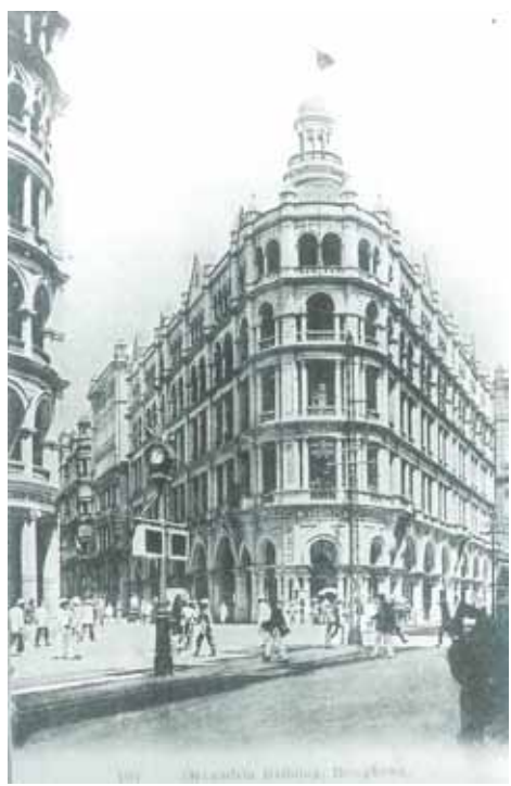
● 德輔道中與遮打道交界的亞力山打行，約1918年。左方為萬順酒店。