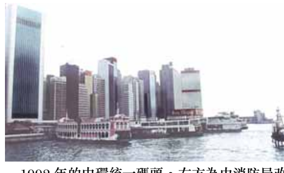
●1992年的中環統一碼頭。左方為由消防局改建的新恒生銀行大廈。這一帶即將填海興建中環機鐵站。