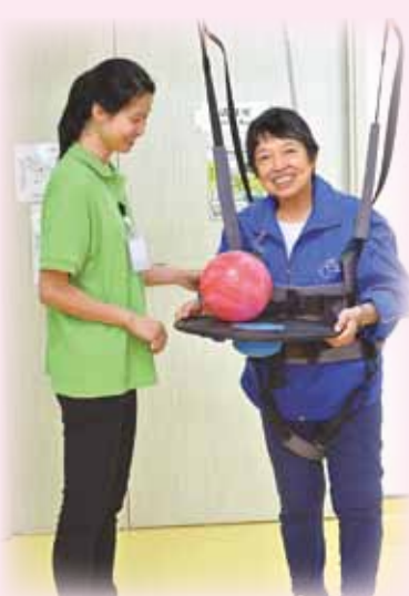
●計劃透過循序漸進的訓練，令大部份長者的活動能力和自我照顧能力均有所提升。