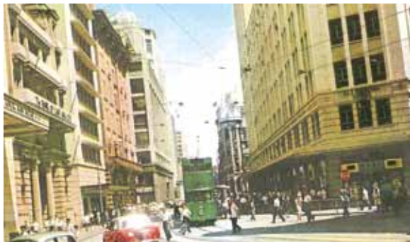
●約1958年的德輔道中銀行區。左方為國民商業銀行及東亞銀行。