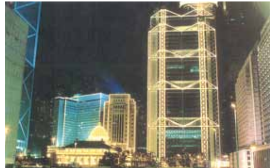
●1990年「電燈節」時的銀行區。