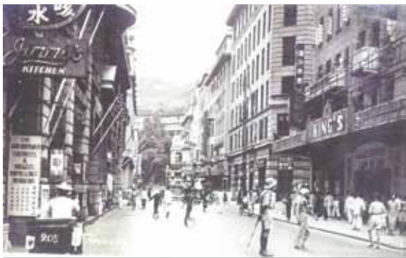
●皇后大道中的華人行(左)及娛樂戲院(右)，正中為銀行區。約1935年。