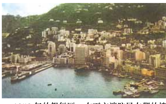
●1958年的銀行區。右下方消防局左鄰的樓宇，正在拆卸以建恒生銀行(盈置)大廈。