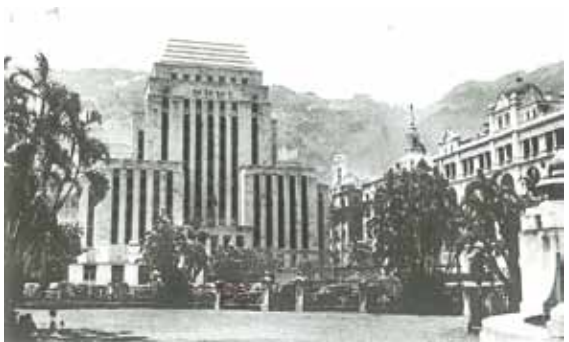
●約1947年的滙豐及其右的渣打銀行。皇后像廣場被用作停車場。