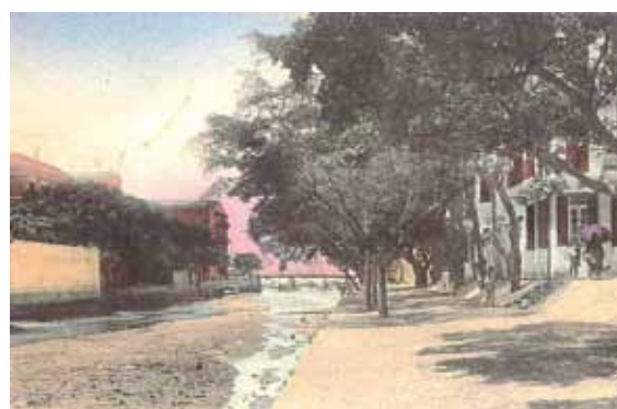
● 約1915年的鸞頸涌（運河）。正中的鸞頸橋現為「打小人」勝地前的軒尼詩道。