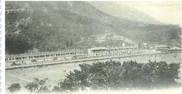
● 跑馬地馬場的第一代主看台，約1900年。

1930年及1955年兩度重建。馬會的看台曾於先前提及的必列者街，是由摩理臣山道橫跨運河而至勿地臣街者。過了勿地臣街則為筲箕灣道，於1980年代重整為禮頓山道（禮頓道）。