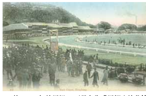
● 約1918年的馬場，可見名為「馬棚」的草竹看台。右方可見堅拿道糖廠的煙囪。