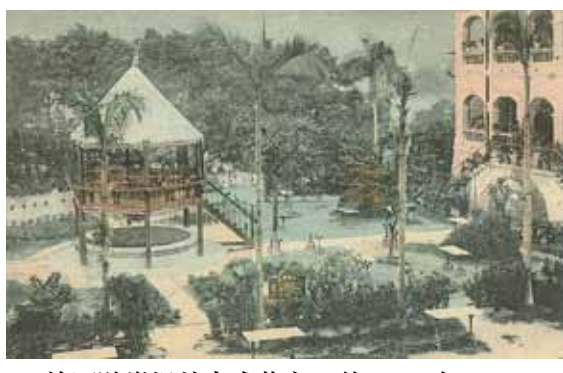
● 愉園遊樂場的中式茶座，約1915年。