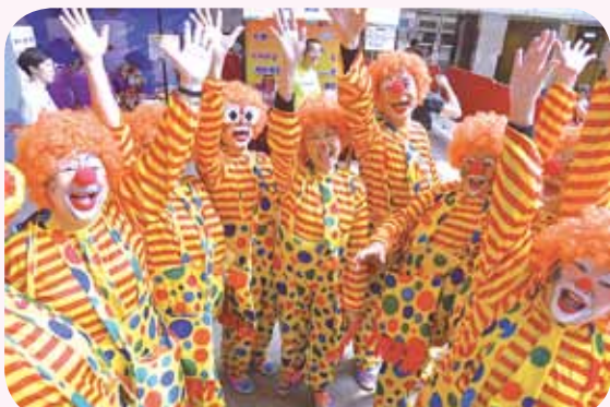
● 「耆青小丑」計劃以快閃手法發放快樂種子，冀共建快樂和諧的社區。