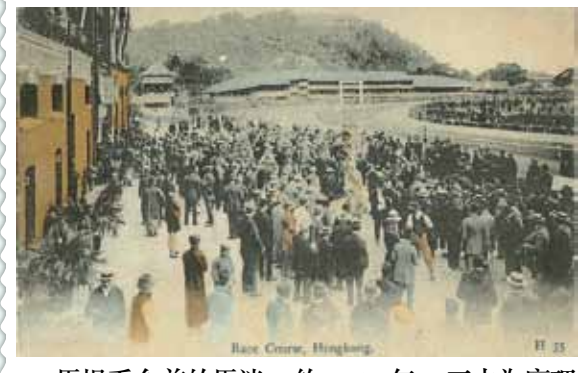
● 馬場看台前的馬迷，約1910年。正中為摩理臣山及山下的草竹棚看台。