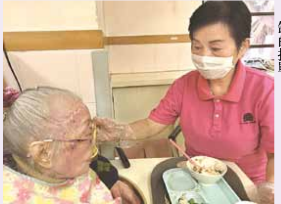
●香港面對安老院舍護理人手短缺的挑戰。

三千元的起薪點增加至一萬五千元至一萬六千元，這樣才具市場競爭力。同時又建議政府目光要長遠，多宣傳敬老護老是有使命的光榮工作，開設長遠培訓學院及銜接課程，鼓勵照顧員完成基礎課程後，仍可以繼續進修，最終能夠與登記護士接軌，