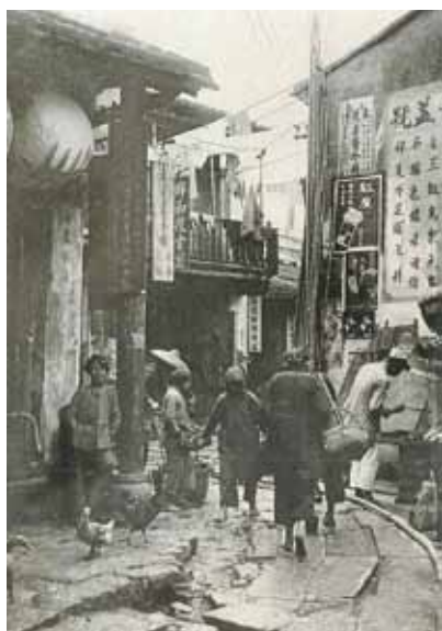
● 寨城內的街道，約 1920 年。