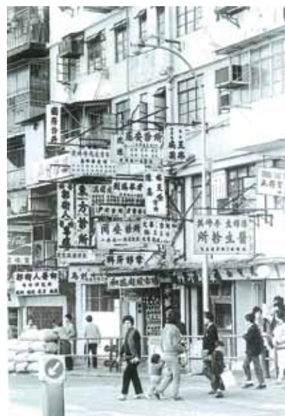
● 東頭村道的寨城區診所，約 1975 年。

1987 年，中英兩國政府決議，將寨城拆卸，改闢為九龍寨城公園，工程於 1992 年開展。