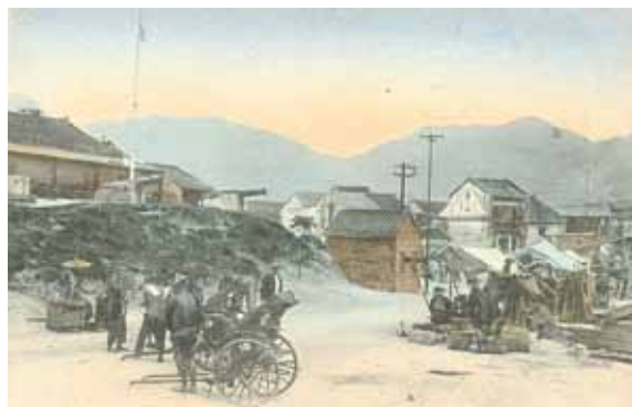
● 九龍寨城的衙門及炮台，約 1915 年。