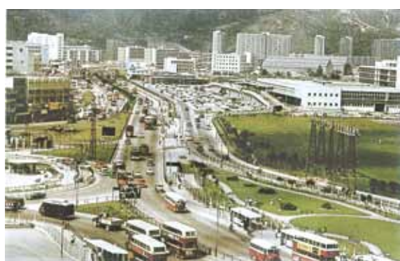
● 九龍城區，1964 年。

1841 年，英國佔領香港島，中國政府為加強九龍的防衛，於 1843 年，在九龍灣旁的九龍寨，興建城垣（城牆），分有東、南、西、北四門，內部亦興建衙署、火藥局、神廟及敬惜字紙亭等建築物，於 1847 年落成。九龍寨城又被稱為城寨或城砦，因設有衙署，其前端的一條馬路被命名為衙前圍道。這一帶的區域因而名為「九龍城」。