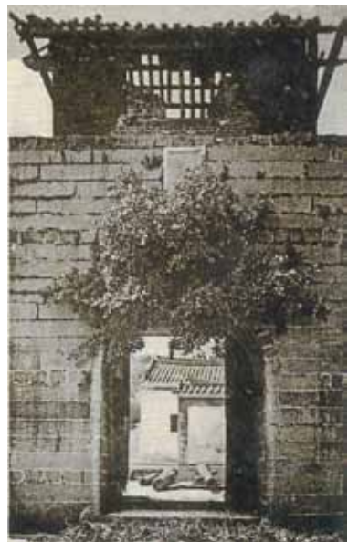
● 九龍寨城的南門及古炮，約 1900 年。