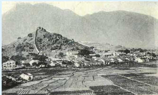
●九龍寨城一帶環境，攝於約1900年。

夏天將至，到沙灘走走吸收太陽的溫暖及吹吹風是讓人愉快的事情。走到淺水灣沙灘旁的食肆，他們店舖的裝修與一般食肆很不一樣，大部分餐廳都是半開放式，讓食客可以更貼近大自然。今次介紹的這食肆，門口擺放著兩張對海的吊椅，讓你可以邊吃邊欣賞大自然的美。餐廳主要提供西式食品，沙律、薄餅及意粉等等。除了肉醬意粉、牛扒等等，大廚亦有一些較與別不同的頭盤及主菜。特別推介他們的沙律——椰菜蘋