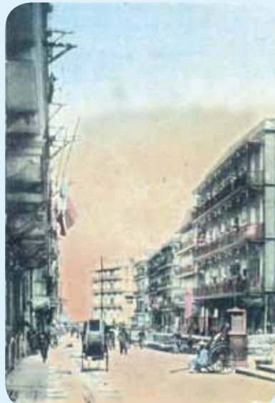
● 約 1918 年的石塘咀山道，為著名的「塘西風月」區。

的倚紅、詠樂、賽花及歡得，現時是長發大廈。其左鄰與德輔西交界是香江酒樓，現為「太平洋廣場」。正中位於電車總站旁是陶園酒家，1950 年代曾為「香港人造花廠」，1980 年代初改建為「香港商業中心」。左方的樓宇為三間妓院，其右旁則有頤和及廣州酒家，後者一直經營至 1970 年。