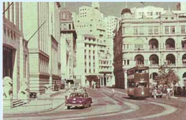
●左方德輔道中一帶銀行，約1903年。