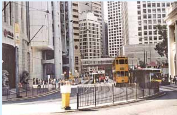
●現德輔道中一帶，左方為中國銀行。