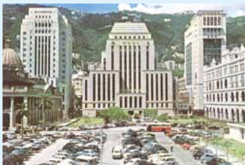
● 銀行區，約 1961 年。

中國與匯豐間的窄街為獲利街，數年後易名為銀行街。早期的獲利街是位於皇后像廣場內。