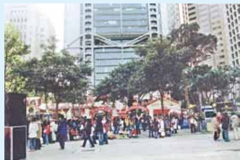
● 現皇后像廣場一帶。