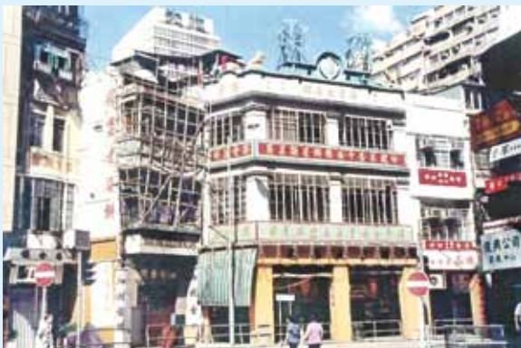
• 1989 年的得雲茶樓。

1989 年。可見橫跨皇后大道中 187 號（中環）與文咸東街 1 號（上環）的得雲茶樓。該開業於 1880 年代的老牌茶樓，於 1992 年結束後以闢新紀元廣場。茶樓右方的