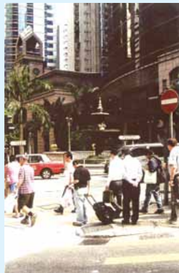
• 現時皇后大道中與文咸街交界一帶。