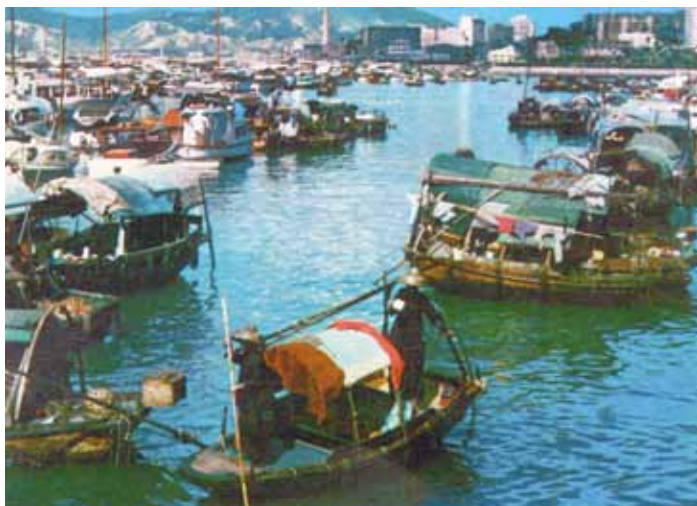
● 銅鑼灣避風塘，約 1962 年。