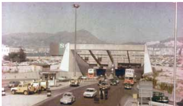
● 剛通車時的紅隧，1972 年。