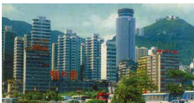
● 約 1978 年的告士打道，右方現為中環廣場左中部的大廈，現為大新金融中心。