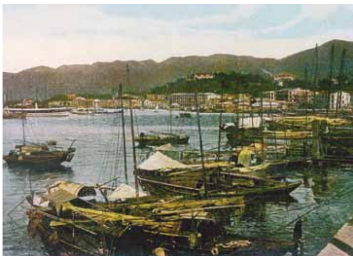
● 由灣仔海旁東(莊士敦道)望銅鑼灣，約 1915 年。

自 早期名為「下環」的灣仔，名稱源至這區的一小海灣，經過數次填海後，小海灣已消失。開埠初期，灣仔的地