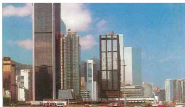
● 由杜老誌道西望灣仔，約 1985 年。