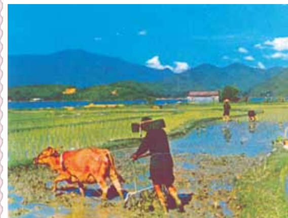
● 元朗的禾田，約 1975 年。

私的愛感染了他們，為我很乖……」余小朋友無照樣刻著：我來過，我心，以後我們的墓碑上謝余妹妹，你一定在天堂看著我們。請你放心小朋友（生命贈與，謝余妹妹，你一直在天小孩說：「我接受了你（余一個成功獲得治療的小同疾病的病孩子身上。第用，全部捐贈予患有相離世。她在生前已決定把餘下所籌得的醫病費達：「Pardon me for not getting up. (恕我起不來了)」。一名姓余的小女孩，是一名孤兒，後因患有急性白血病不幸