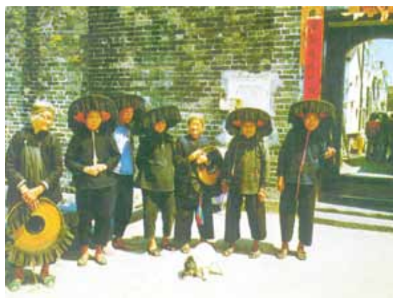
● 吉慶圍前的客家婦女，約 1965 年。