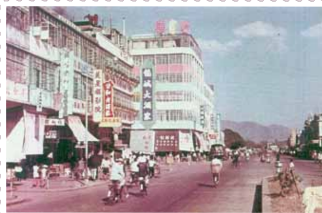
● 元朗大馬路，約 1962 年。左方為谷亭街。