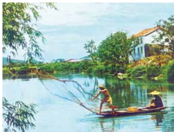
● 稱為「圍」的漁塘，約 1970 年。