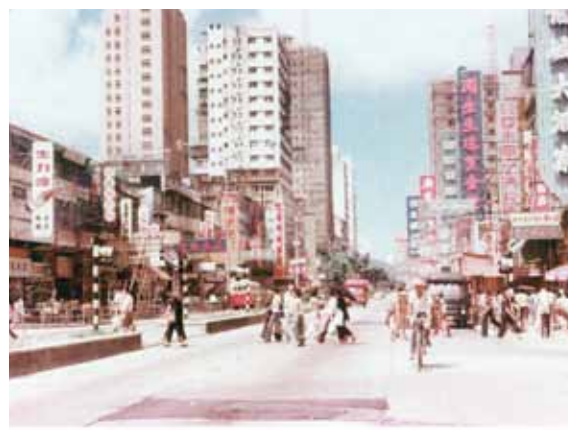
● 由谷亭街望元朗大馬路，約 1967 年。