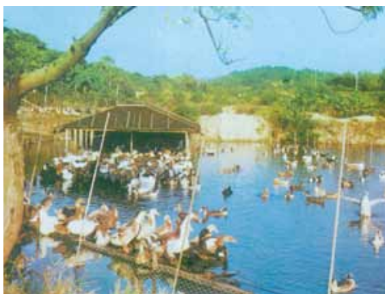
● 元朗的養鴨人家，約 1965 年。