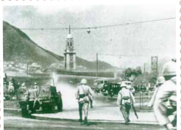
● 1941年12月8日，進攻尖沙咀的日軍。