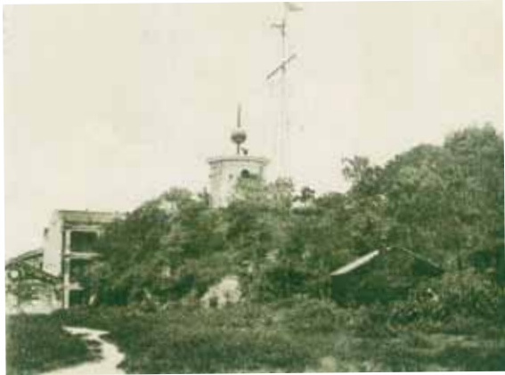
● 廣東道上的第一代時球台，約1905年。