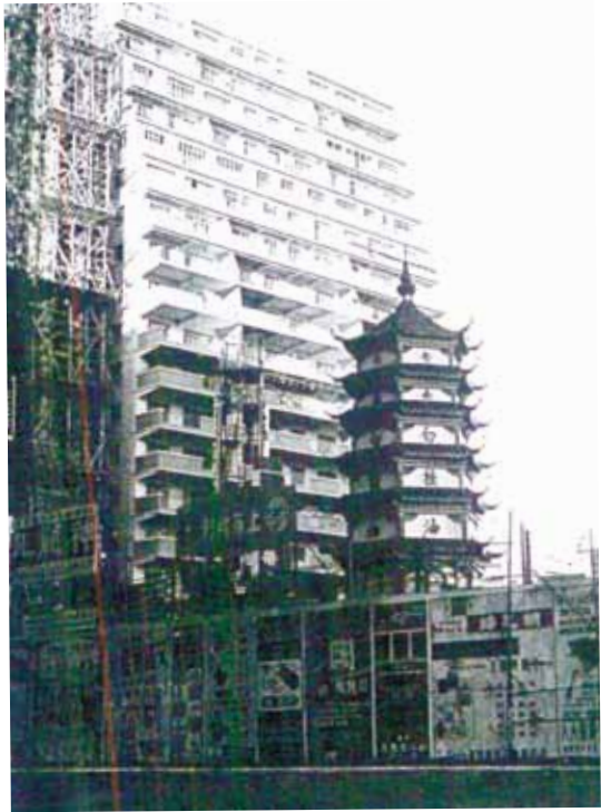
● 1959-60年的工展會，所在現為喜來登酒店。

位於半島酒店旁的一空地，曾於1920-30年代舉辦若干屆「英帝國展覽會」。由1940年起，亦舉辦過多屆工展會，1970年，用作興建喜來登酒店，於1973年落成。