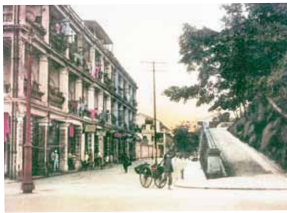
● 由梳士巴利道望廣東道，1910年。正中是九龍倉。