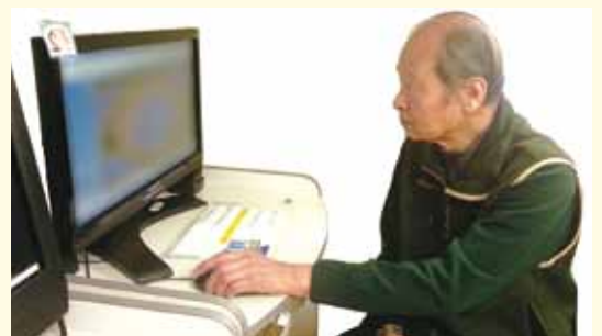
● 透過腦功能評估，可及早辨識是否出現早期腦退化症徵兆