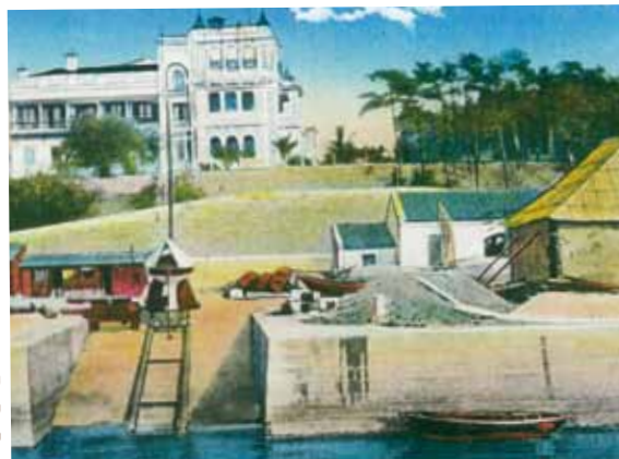
● 水警總部及水警輪滑道，約1905年。