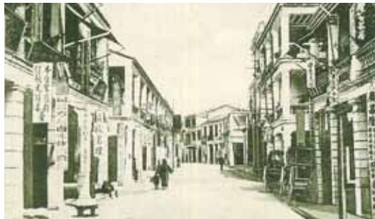
● 由水坑口街望皇后大道西，約1895年。右方可見一「廣昌隆」百貨店。