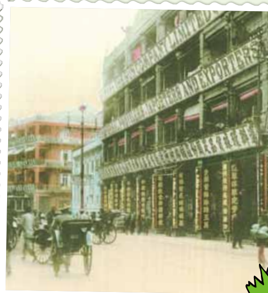
● 第一代大新公司（右）、新世界戲院（中）及永安公司（左），約1912年。