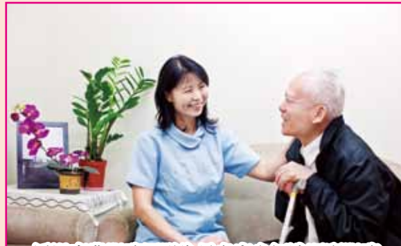
● 透過專業服務團隊為長者度身訂造照顧服務。

「頤·在家安老策劃服務」已開始接受申請，55歲或以上有需要接受上述照顧服務人士，可致電81000659查詢或瀏覽以下網址： www.sjscare.org.hk 。