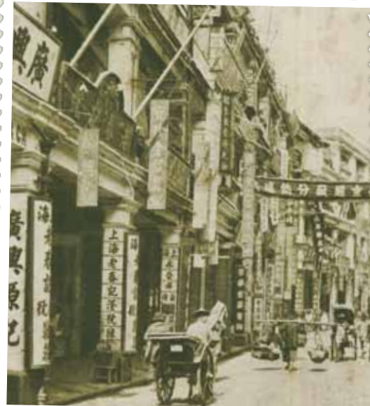
● 由樓梯街西望皇后大道中的百貨店，約1915年。