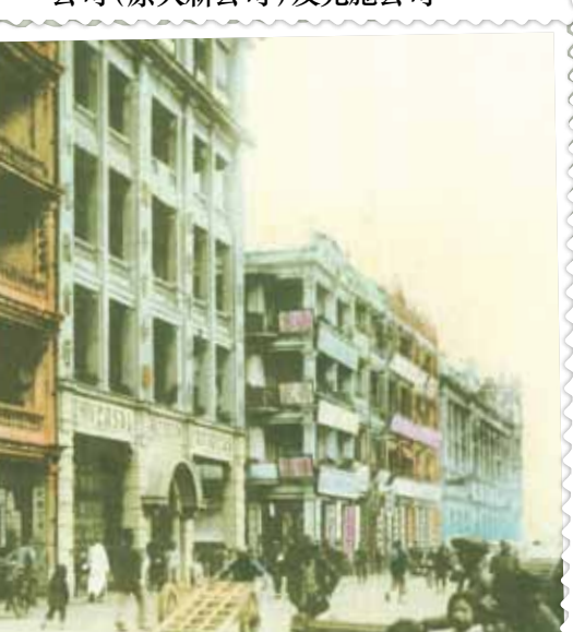
● 約1916年的干諾道中先施公司。