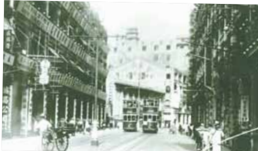
● 約1935年永安公司，背景可見第二代的大新公司。