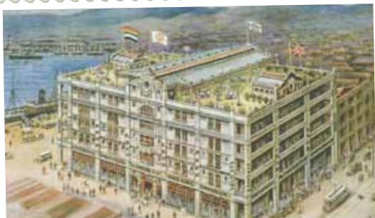
● 剛落成，位於德輔道中（右），永和街（中前）及干諾道中的先施公司圖繪，1916年。