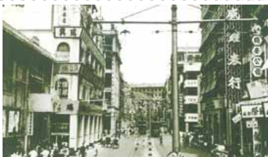
● 由林士街永安公司前東望德輔道中，約1950年。由左至右為新世界戲院、瑞興公司（原大新公司）及先施公司。