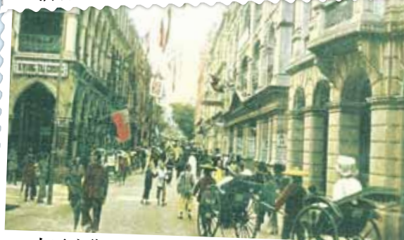
● 由雪廠街西望皇后大道中，約1915年。正中的丫士打酒店現為置地廣場文華酒店。