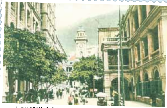
● 由德輔道中望畢打街鐘樓，約1905年。左方是香港大酒店。