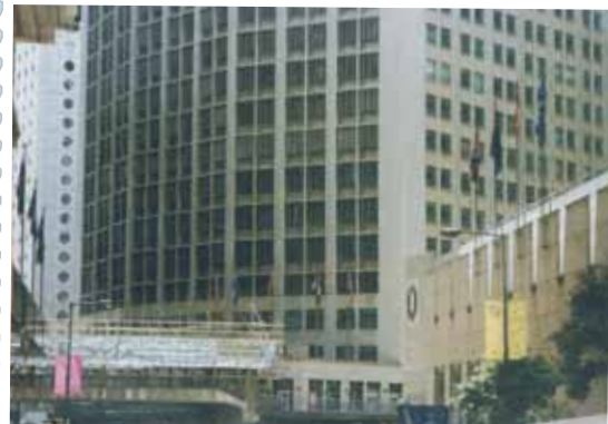
● 1997年的畢打街置地廣場及太古大廈(現遮打大廈)。