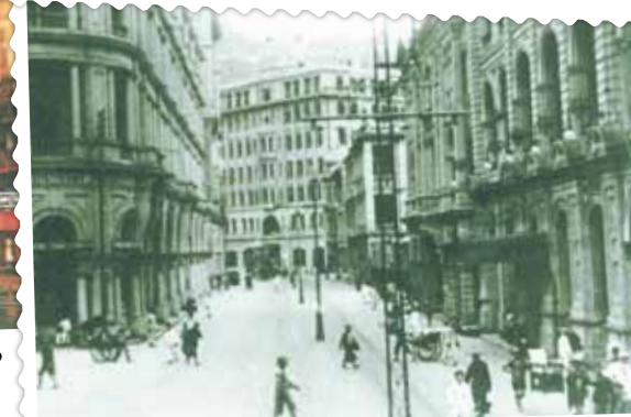
● 由畢打街東望德輔道中，約1925年。左方是歷山大廈，右方是香港大酒店。