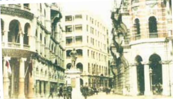
● 由干諾道中望畢打街與德輔道中交界的香港大酒店，約1915年。可見干諾公爵銅像。