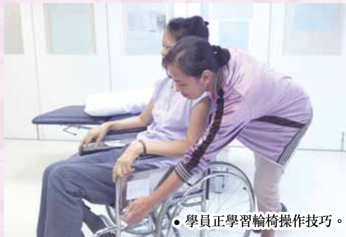
● 學員正學習輪椅操作技巧。

$200至$900不等。計劃幸獲「陳登社會服務基金會」贊助，有需要人士可申請免費報讀課程，詳情請致電2386 7066向耆康會職員查詢。