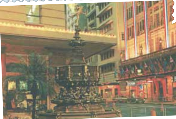
● 德輔道中的連卡佛大廈(右)及皇室行(中)，約1966年。左方是歷山大廈。