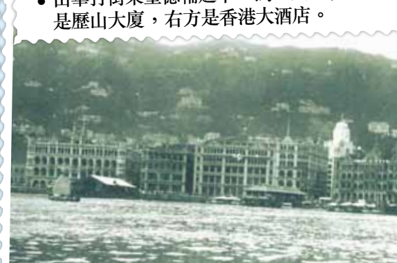
● 約1932年的中環干諾道海旁，可見畢打街告羅士打酒店的大鐘樓。