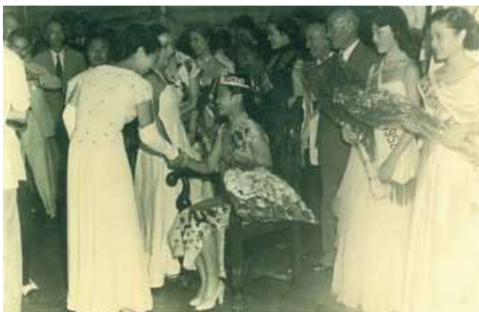
●在麗池舉行的香港小姐選舉，1952年。