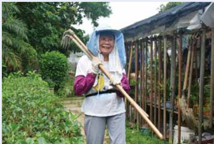
●長者在農場體驗耕種樂趣。

在健康長者農場內，長者義工不單可以享受農耕樂趣，他們更可按自己的才能和喜好，發揮所長參與農場的各項工作，在日常農務工作上，如除草、澆灌、收割、播種及簡單工程等；有部份義工可選擇接待農場日營及探訪活動的參觀者，協助活動推行，帶領遊覽