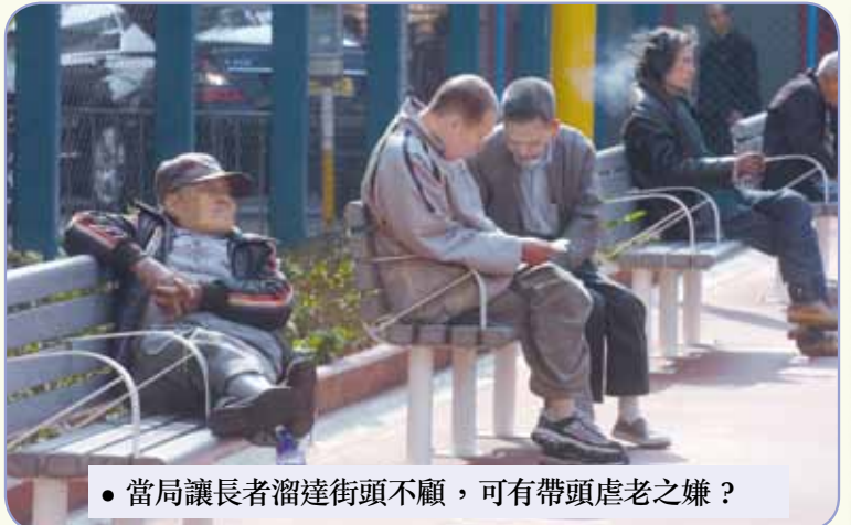
●當局讓長者溜達街頭不顧，可有帶頭虐老之嫌？

其他還包括侵吞財產等。有數據亦顯示香港最少有5.39%的長者人口曾被虐待，以香港現時的長者人口推算，即香港最少有超過5萬名長者處於被虐的困境。有社工指出，不時有家庭照顧者不堪壓力，對患者拳打腳踢，甚至索性把患者帶到香港境外或醫院後「失蹤」，企圖逃避照顧責任；他認為，此正顯示本港護老支援服務不足，令護老者承擔莫大壓力，情緒無法紓緩，因而感到照顧長者是負累，產生厭惡感，致令長者受虐，故當局除改善長者服務外，亦要不忘護老者的支援服務。社工亦質疑，為何政府目前只為受虐婦女、兒童提供專門服務，如和諧之家與防止虐待兒童會等，卻未有專責機構協助受虐長者，如