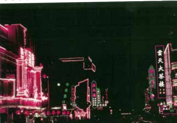
● 佐敦道雲天、美化茶樓及統一酒樓的月餅宣傳。左為快樂戲院，約 1964 年。