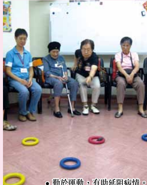
● 勤於運動，有助延阻病情。

膳)，而 2 人或以上家庭出席，可攜同患者參加，每位只收 $50；報名請附姓名、地址及聯絡電話，連同相應參加人數的費用(請用支票，抬頭：聖雅各福群會)，逕寄香港灣仔石水渠街 85 號 1 樓。電話：2816-9009 或 2835-4325。