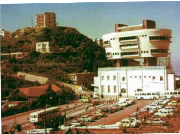
● 山頂第二代老觀亭，約 1975 年。