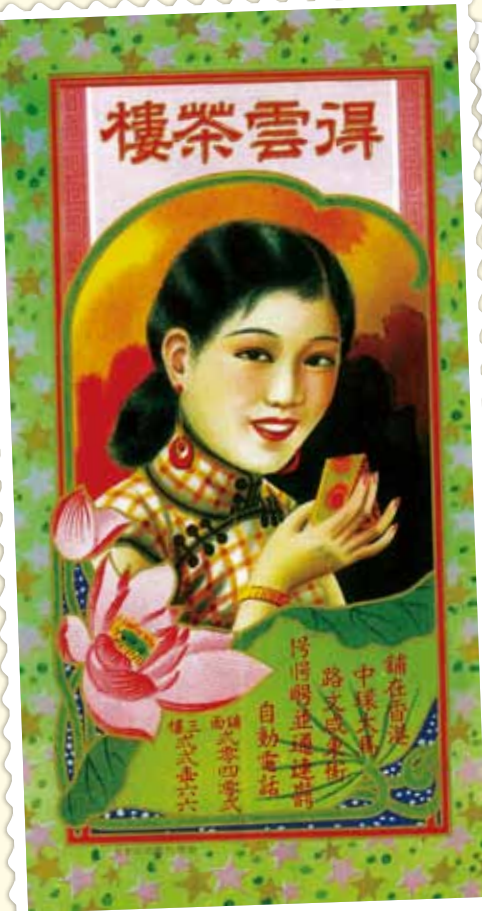
● 得雲茶樓月餅宣傳單張，約 1950 年。