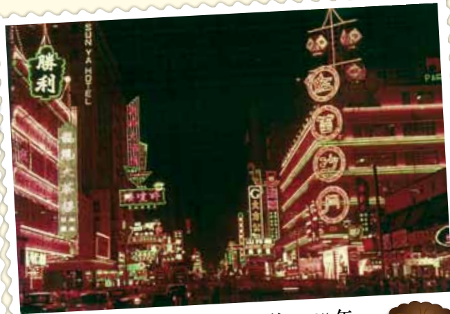
● 旺角瓊華酒樓及龍鳳茶樓，約 1965 年。