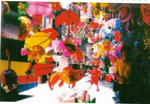
● 花燈，2001 年。