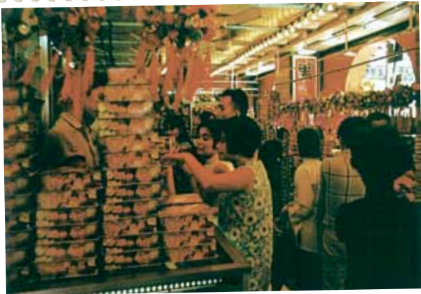
● 在瓊華酒樓購月餅的人群，約 1960 年。