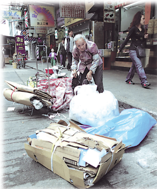
●欠缺社會保障的寫照！

陳婆婆坦言：「而家淨係靠71歲丈夫做看更份人工，每月賺得唔夠四千蚊，惟有食方面慳啲，不過真係好擔心