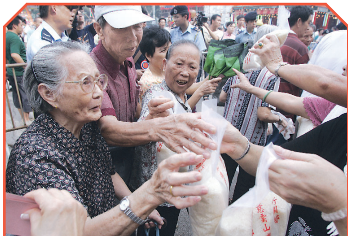
◆文：林文傑

政府同時呼籲孟蘭主辦機構在有需要時，應識別區內特別需要協助的長者，包括年老體弱、乏人照顧、健康欠佳的長者，及早組織義工隊，協助把米包派發到他們的家中，以能真正收「派平安米，長者得平安」之效。