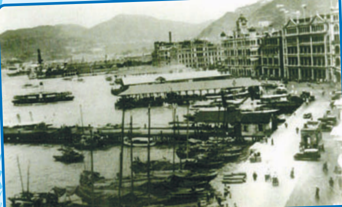
• 約1930年的卜公碼頭(中)，其後是天星及皇后碼頭。