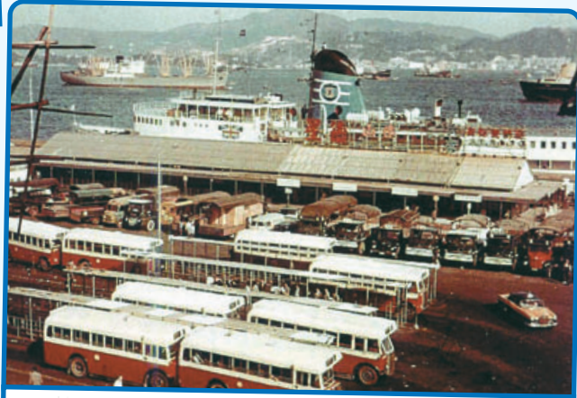
• 林士街港澳碼頭和巴士總站，約1963年。