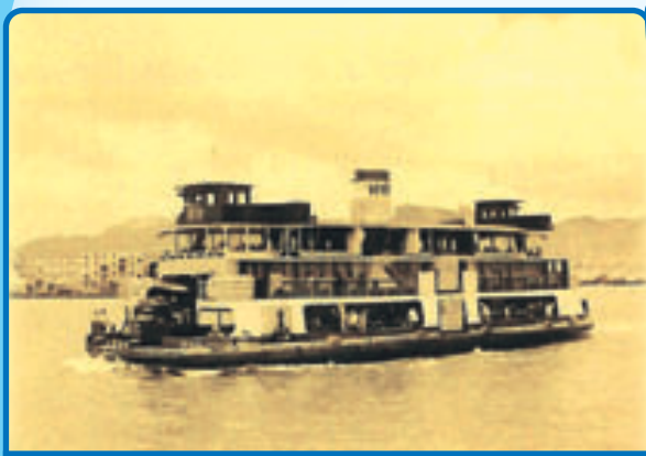
• 第一代汽車渡輪「民讓」號，1948年。