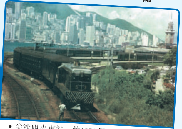
• 尖沙咀火車站，約1971年。

你可有感到社會甚少有關長者的正面及積極訊息嗎？作為長者的你，可欲一改社會對長者負面的認識嗎？