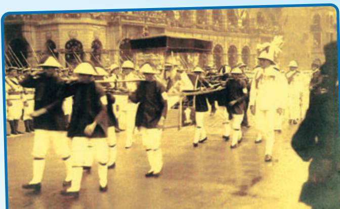
• 愛德華皇儲乘坐八人大橋經過干諾道中，1922年。