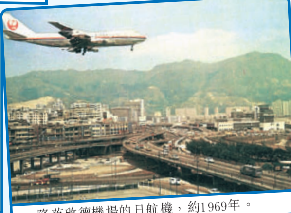
• 降落啟德機場的日航機，約1969年。