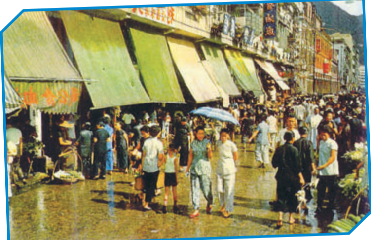
• 約1955年的鵝頸堅拿道東市集。