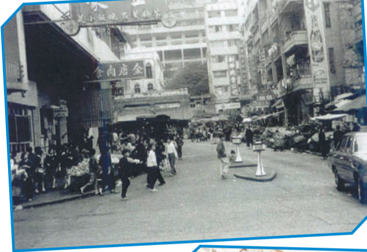
• 約1965年的山道，正中的一層屋是石塘咀街市。