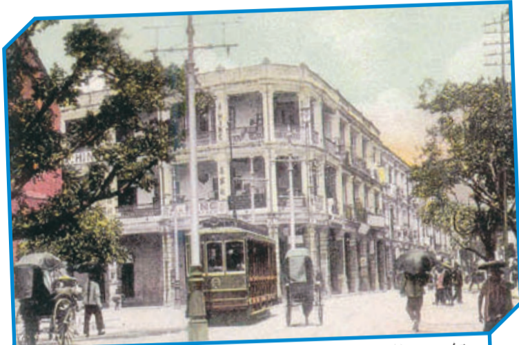
• 曾為東區街市的灣仔皇后大道東大佛口，約1905年。